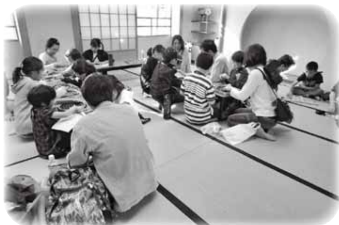
脳トレ～マナビィランド《体験》

団体であれば、どなたでも登録できます。地域・学校・福祉施設などで発表したり、教えたりします。