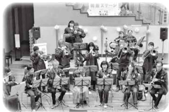
吹奏楽アンサンブル ～マナビィランド《ステージ》